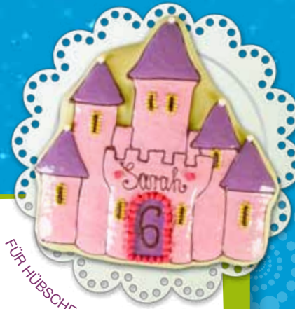
FÜR HÜBSCHE PRINZESSINNEN